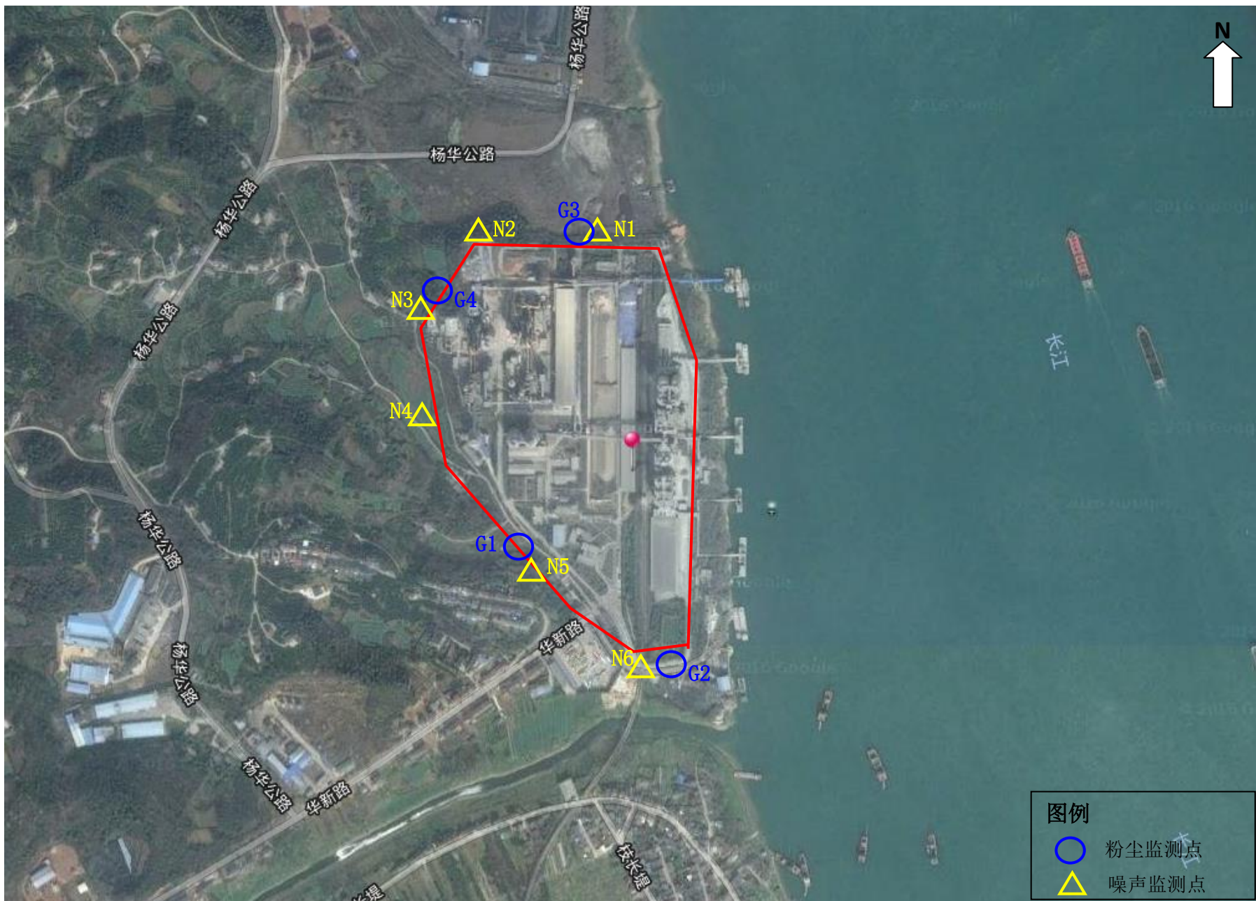
图 7-1 监测点位示意图