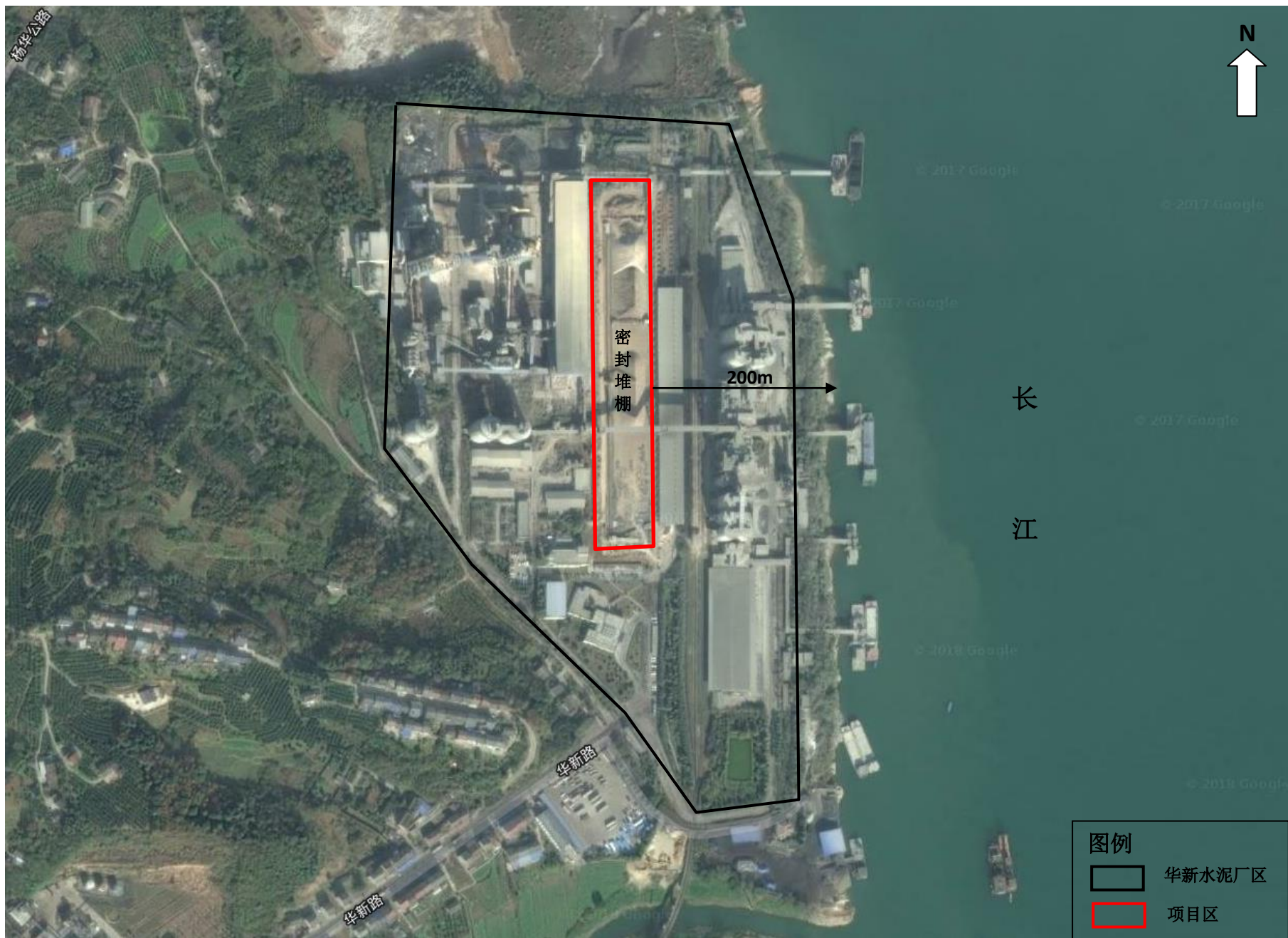
图 3-2 项目平面布局图